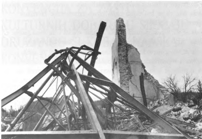
Voćin, ožujak 1992. Ruševine i ostaci konstrukcije krovišta crkve Blažene Djevice Marije od Pohoda.