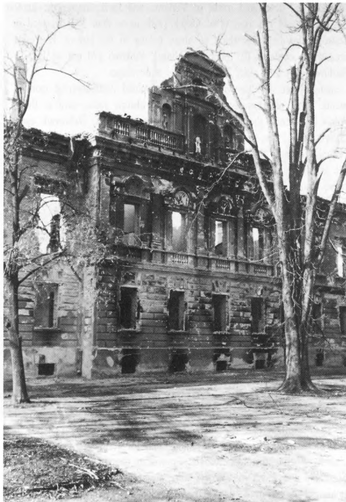
Vukovar, 1991. Zgrada MUP-a i Suda

Na međunarodnim su skupovima o ratnim razaranjima kulturne baštine u Hrvatskoj i u inozemstvu tijekom 1991./1992. godine stručnjaci MDC-a izvještavali i o kompleksu problema u provedbi Haaške i ostalih međunarodnih konvencija u odnosu na pokretnu, muzejsku, baštinu. Štete tijekom rata unutar muzejsko-galerijske mreže nastale su kako ciljanim razaranjem zgrada muzeja, nepokretnih spomenika, tako i oduzimanjem i premještanjem na područje druge države i napuštanjem objekata u kojima se nalaze spomenici kulture velike vrijednosti. Ratifikacijom Konvencije za zaštitu kulturnih dobara u slučaju oružanog sukoba, donesene u Den Haagu 1954. godine od strane FNRI 1955. godine proizlazi obaveza pridržavanja odredaba Konvencije u cilju